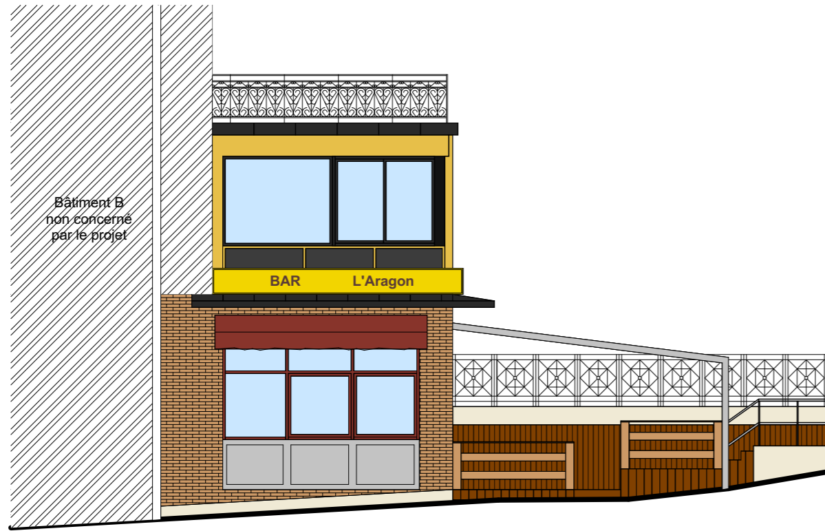
Façade Ouest (existant)