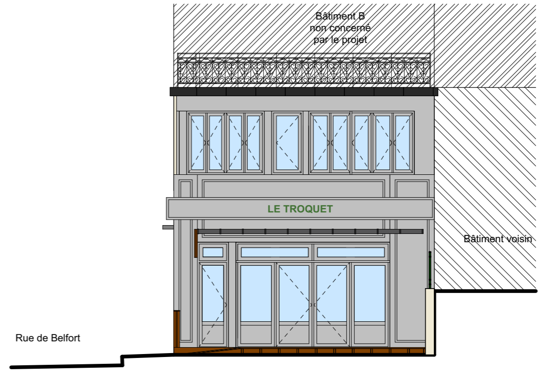
Façade Sud (projet)