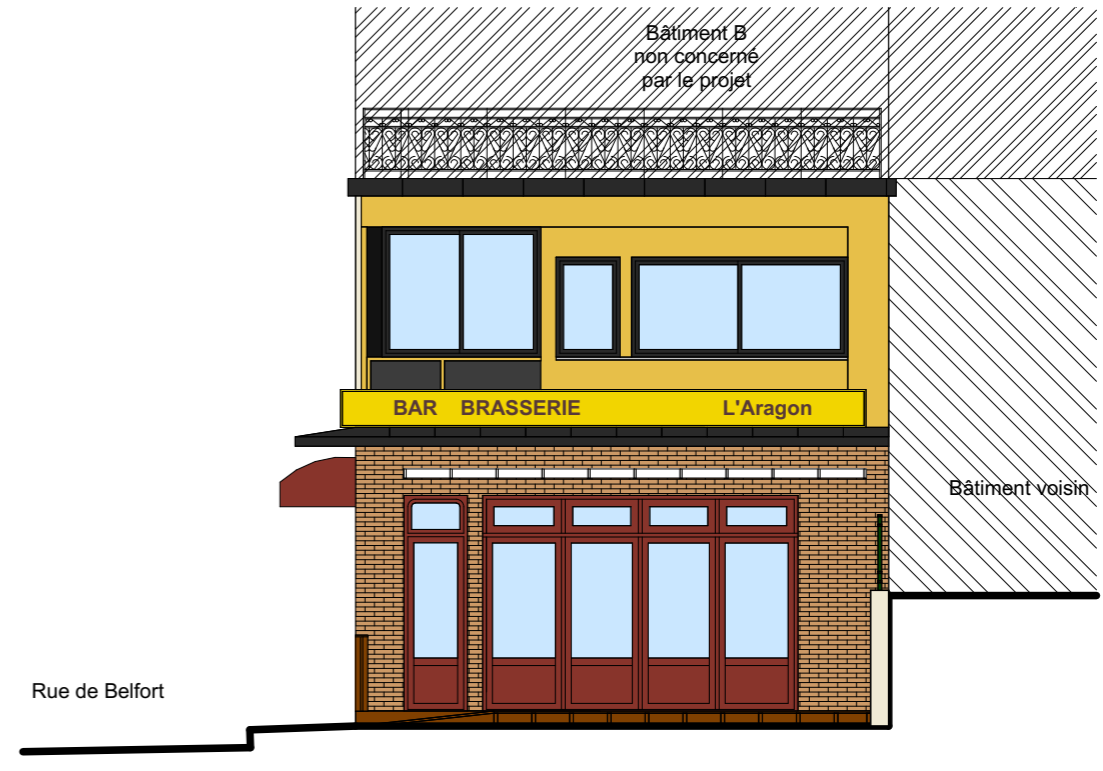
Façade Sud (existant)